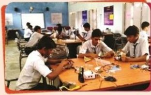
अटल टीकरींग प्रयोग शाणा ज.न.वि. अदीलाबाद (तेवंगाणा)

जवाहर नवोदय विद्यालय पसंदगी परीक्षा द्वारा जवाहर नवोदय विद्यालयमां २०१८-२० दरम्यान धोरण-६ मां प्रवेश माटे ओनलाईन अरखओ आमंत्रित करवामां आवे छे.