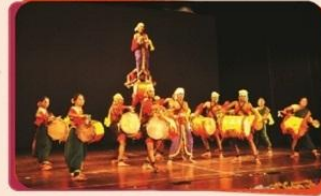
ज.न.वि. मांडया (कण्टिका)ना विद्यार्थीओ द्वारा 'डोल्लु कुनीता' कथा प्रदर्शन