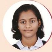
नेश्मा मेठी ज.न.वि. दशील गोवा