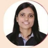
क्षपानकुमारी ज.न.वि. शेओडर NEET 2018 मां टोपर

आंतरराष्ट्रीय प्रवेश - २०१८ माटे पसंदगी पावेल विद्यार्थीनीओ